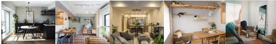
▲ RE : Apartment UNITED ARROWS LTD.