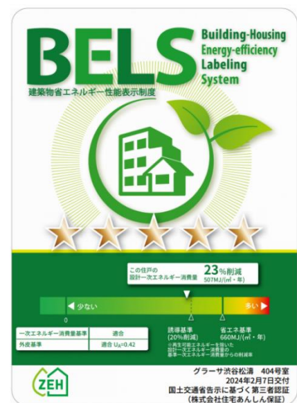
▲画像② 国土交通省告示に基づく第三者認証の性能表示