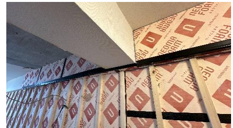
▲画像① ZEH 水準 断熱施工の様子

本物件は ZEH 水準リノベーションにより、住宅設備等にかかる一次エネルギー消費量が省エネ基準より 23%削減され、国が定めた省エネルギー基準相当の家との比較をすると、約 17%の光熱費削減が見込まれます。