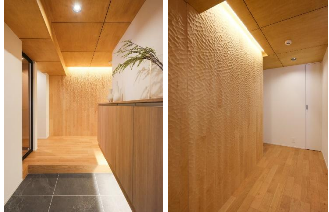
▲左：玄関 右：なぐり加工の壁

また、窓からの温かい光が放射線状に美しく射すよう、パーティカルブラインドをリビングの一面に採用しています。さらに、リビングドアのアンバーガラスを通して、玄関にも光が入ります。