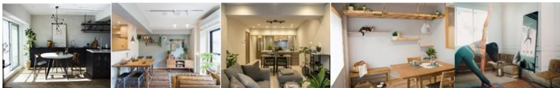
▲RE : Apartment UNITED ARROWS LTD.