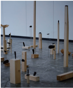
図版2. 齋藤まつり《九十九、私》 木炭、鉄、モルタル、紙 H1300×W2500×D3000 (mm) 2022年