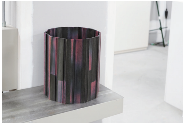
図版4. 竹下早紀《Eeyo(イーヨー)》 バルサ材 H280×W250×D250 (mm)