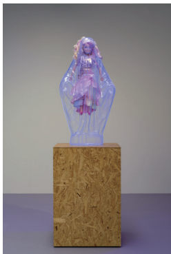
図版5. 永井天陽《metaraction #32 PL-1》 パービー、アクリル材 H1020×W530×D280 (mm) 2023年