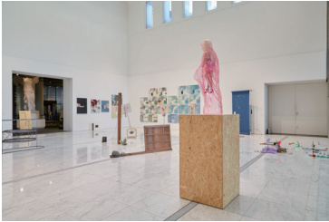
参考 「助教・助手展2023 武蔵野美術大学助教・助手研究発表」 会場風景