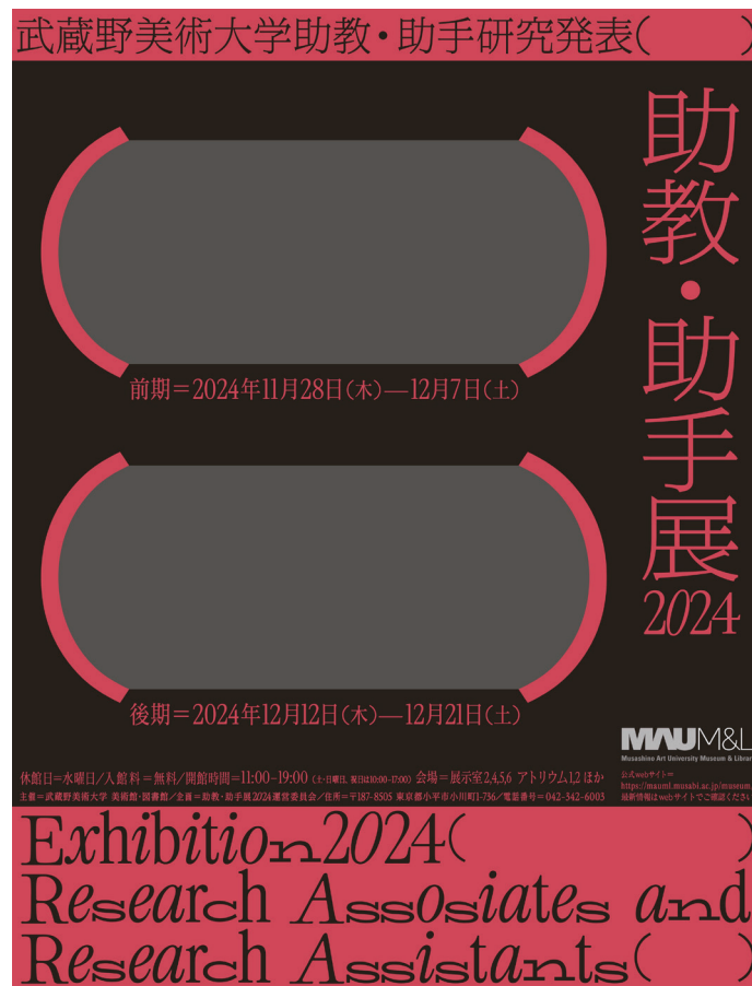
図版 1. 「助教・助手展 2024 武蔵野美術大学助教・助手研究発表」メインビジュアル デザイン：Cat 佐藤翔子