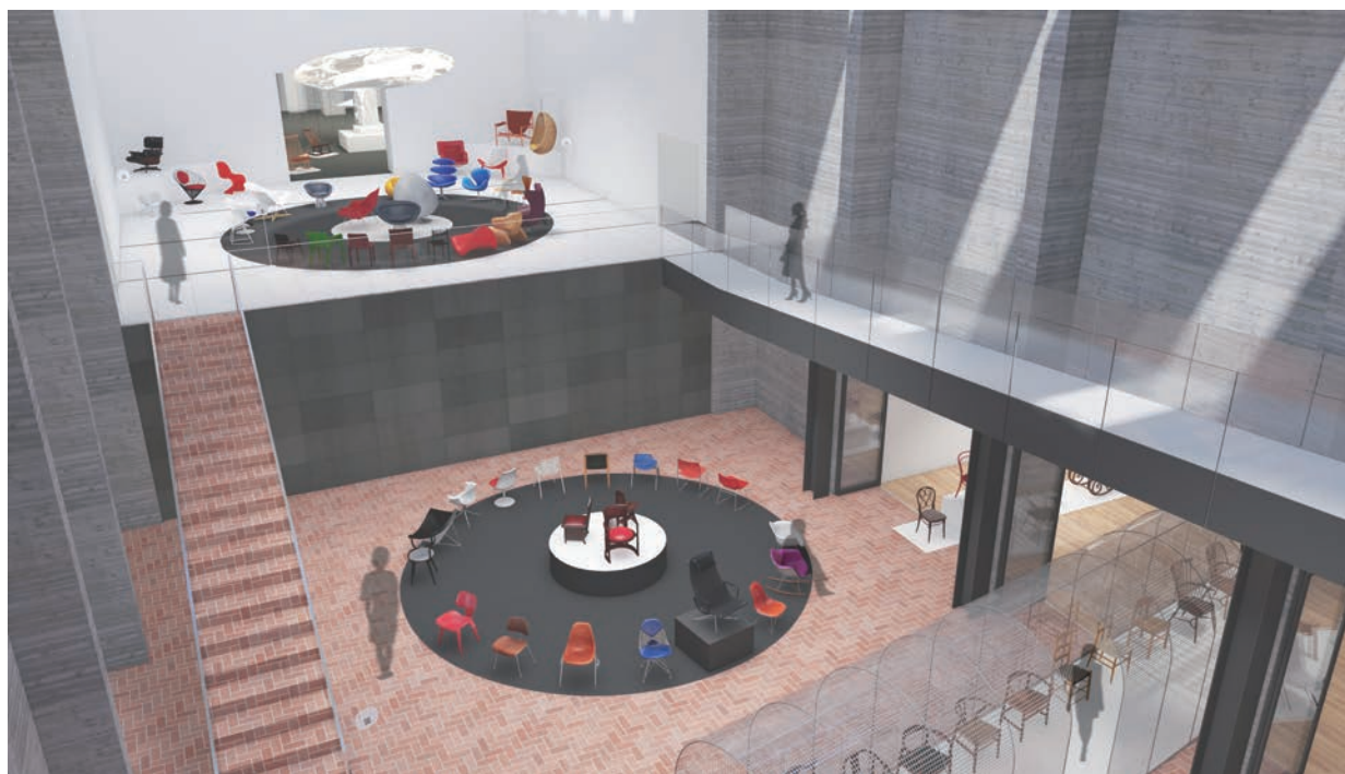
図版1. 展示会場イメージ