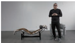
図版20. 椅子解説動画イメージ