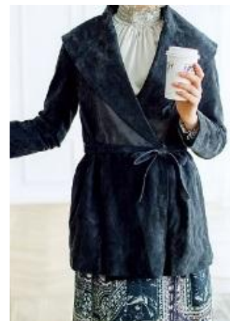
〈ダブルビー〉 コート 194, 400円 ブラウス 36, 720円 ■本館3階ダブルビー

たおやかなフォルムの大きな衿が印象的なコートと、首元にギャザーを寄せたブラウス。どちらも首まわりに視線を集め、エレガントに引き立てます。