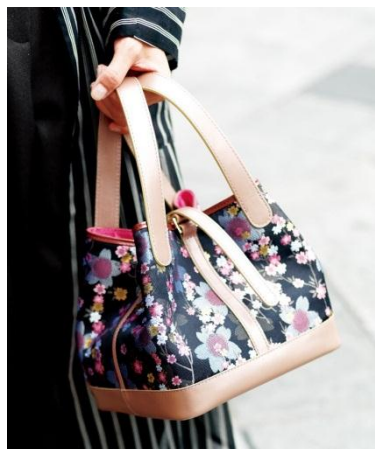
【銀座店限定】 〈ルサックアダム1980〉 ハンドバッグ 27,000円