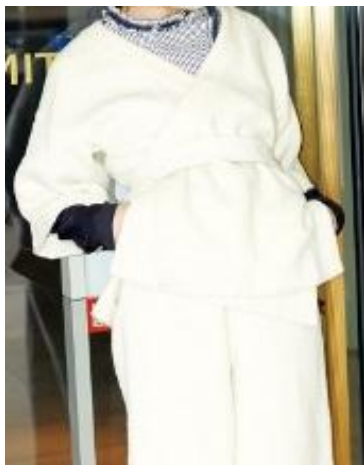
【銀座店限定】 〈ミューラ オブ ヨシオクボ〉 ジャケット 34,560円 パンツ 34,560円 ■3階ル プライス

日本の伝統文化が再注目されるなか、日本の気鋭デザイナーたちが国技をモチーフにした三越伊勢丹限定の新作をリリース。〈ミューラ オブ ヨシオクボ〉からは柔道着風シルエットにウール素材を掛け合わせたジャケット&パンツが到着しました。