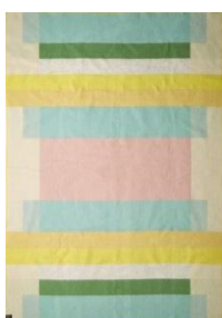
〈クリスティン ファイブ メルヴェ〉