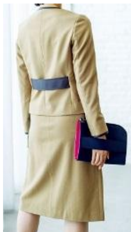
〈モガ〉 ジャケット 58, 320円 スカート 47, 520円 ■本館3階モガ

仕事でも後ろ姿まで美しく。背中のベルトがウエストをシャープに見せるジャケットは、ドライクリーニング可能なレザーを用いて仕立てました。