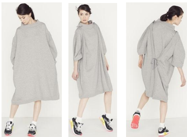
〈アンリアレイジ〉ドレス 31, 320円