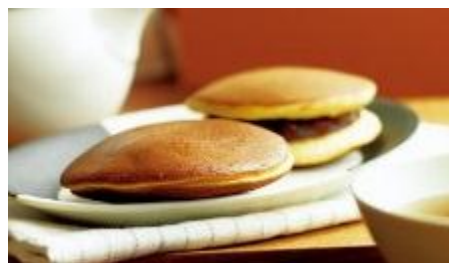
(左から) 〈銀座甘楽〉どら焼 (1個)186円 〈菓子舗 栄太楼〉どらやき (1個)181円 ■地下2階菓遊庵

シンプルな“どら焼き”も、比べて味わえば実に奥が深いもの。〈御笠山〉〈円坊〉〈亀屋良長〉〈俵屋吉富〉など老舗・名店のどら焼きを10種類以上お楽しみいただける「どら焼きコレクション」。生地・餡・糖度の違いを店頭で詳しくご説明いたします。