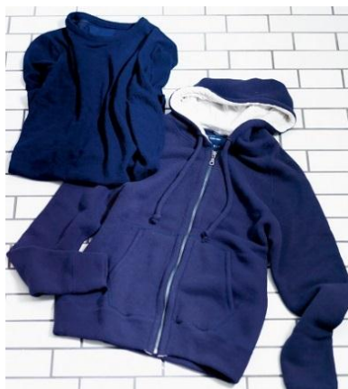
〈ヴィルム ネイビー〉 パーカー 24,840円 ウール カット アンド ソーン 20,520円 ■6階紳士カジュアルセレクト

ジャパンメイドの品質を誇るニューヨークのメンズブランド〈ヴィルム〉から、三越伊勢丹限定レーベル〈ヴィルム ネイビー〉が誕生。日本人男性向けにサイズを微調整して着心地をさらに高めたアイテムを、優雅なネイビーでご提案します。