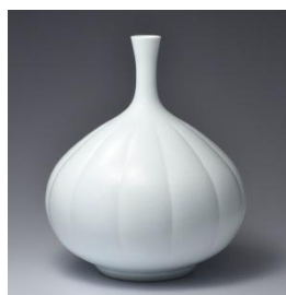
井上萬二 白磁彫文鶴首花瓶 径31.0cm×高36.0cm 2,160,000円

重要無形文化財保持者(人間国宝)から有田陶芸協会所属の陶芸作家まで、優れた技術を輩出してきた有田焼400年の匠の技による、現代有田を代表する優品をご紹介します。