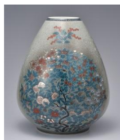
十四代今泉今右衛門 色絵薄墨墨はじき四季花文花瓶 径25.1cm×高29.8cm 1,944,000円