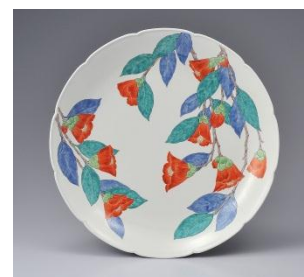
十五代酒井田柿右衛門 濁手椿文皿 径35.8cm×高5.8cm 864,000円