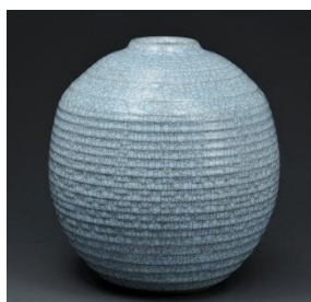
中島 宏 青磁彫文壺 径28.5cm×高30.0cm 2,160,000円