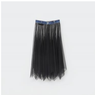
<Yue> スカート 価格未定 伊勢丹 新宿店 その他の展開店舗未定