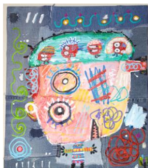
<肥塚毅> デニムアート 10号 385,000円 伊勢丹新宿店