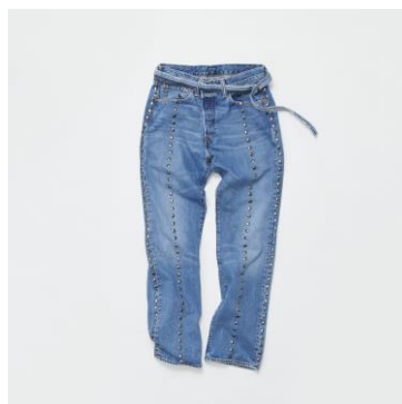
<AKIRANAKA> デニムパンツ 59,400円 伊勢丹新宿店・岩田屋・阪急うめだ本 店・MIDWEST