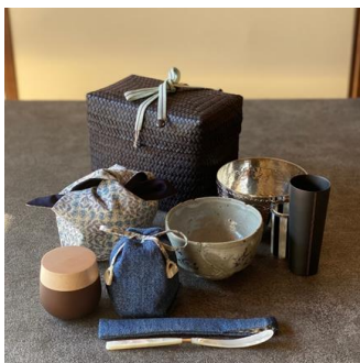
<嘉門工藝> 旅持ち茶籠「デニム」 の宝箱 77,000円 伊勢丹新宿店