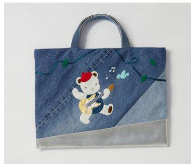
<familiar> デニムバッグ 価格未 定 伊勢丹新宿店