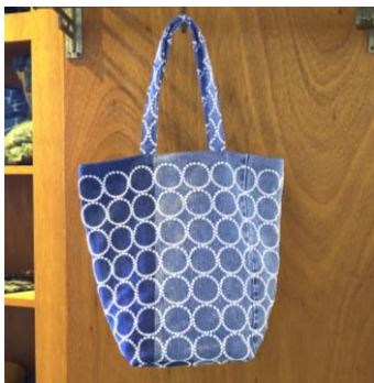
<minä perhonen> トートバッグ 35,200円 伊勢丹新宿店 その他の展開店舗未定