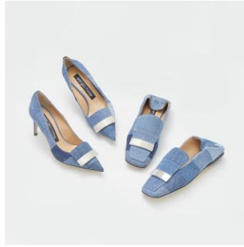
<Sergio Rossi> ウィメンズシューズ 左)121,000円 右)132,000円 伊勢丹新宿 店・岩田屋・阪急うめだ本店(予定)