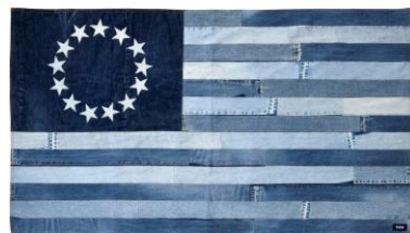
<Safari Lounge> フラッグ 価格未 定 伊勢丹新宿店