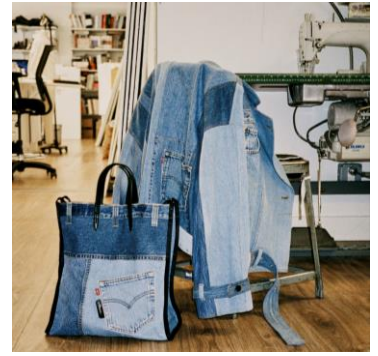
<3.1Phillip Lim> ジャケット・トート バッグ 価格未定 伊勢丹新宿店・岩 田屋・阪急うめだ本店