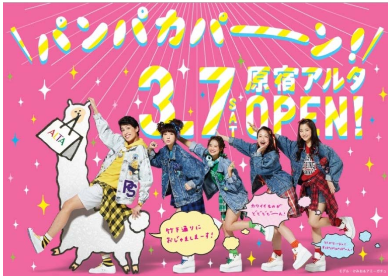
※原宿アルタオープンビジュアル（モデル：けみお&アミーガチュ）