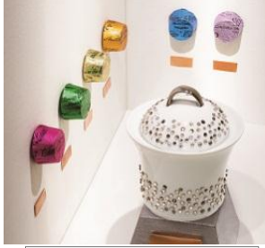
三越日本橋本店限定

モナコ公室御用達の2ブランドがコラボレーション。グレースケリー公妃の婚礼の引き菓子にも使われた<ショコラトリー・ドゥ・モナコ>のショコラを<マニュファクチャー・ドゥ・モナコ>のスワロフスキーが散りばめられた陶器に詰め合わせました。 シルバービジュモナコ (6個入) 陶器: 直径9.5cm×高さ12cm 27,000円 ■本館7階 催物会場