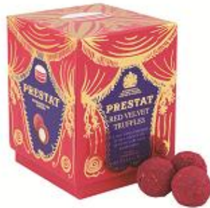
三越日本橋本店限定

ロンドンの老舗ショコラトリーのトリュフシリーズ最新作が日本初登場。ラズベリーをたっぷり使用した真っ赤なレイヤーケーキをひと粒のトリュフチョコレートで表現しました。 レッドヴェルヴェットトリュフ (175g) 3,240円 ■本館1階 中央ホール 本館7階 催物会場