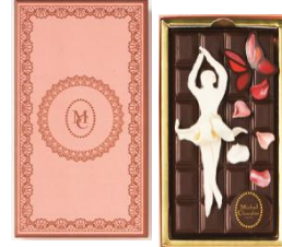
伊勢丹新宿本店限定

ビターな味わいのクーベルチュールタブレット。プラスチックチョコのバレリーナや蝶が舞い踊る華やかなひと品です。 バルリン 2,862円 ■本館7階 催物場