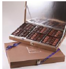
三越日本橋本店限定

M.O.F.(フランス国家最優秀職人賞)を受賞し、創業20年以上を経てなおクオリティの高いショコラを追求し続けるショコラ界の重鎮。宝石のようなボンボンショコラを詰め合わせた、ラグジュアリーなトランクボックスをお楽しみいただけます。 カーヴアショコラ 96個入 37,032円 ■本館7階 催物会場