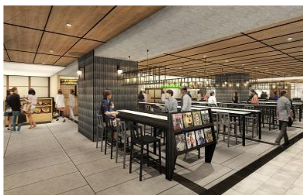
「CAFÉ & DELI PLAZA」イメージパース