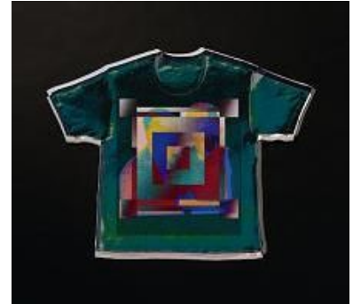
Tシャツ10, 500円から(レディス・ユニセックス各S・M) ※オーダーのデザインによって価格が異なります。