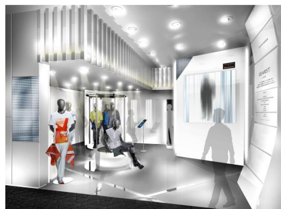
※画像はイメージです。