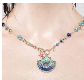
「She! See! Sea!」