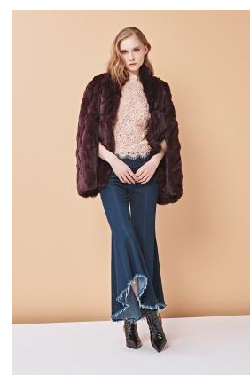
モンゴリアントリムレックス