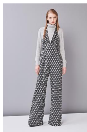
キュービックニット