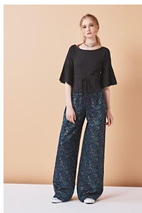
チューリップシャニールジャガード