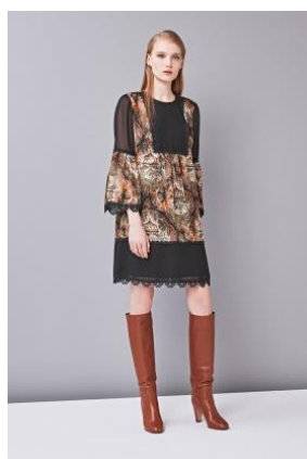
パゴダ (ワンピース)

「日本人が買いやすく着やすいアナ スイ」をテーマに、ブティック（店舗）とは異なった独自の目線でセレクトした ANNA SUI のアイテムを一点だけ使用し、日本人に取り入れやすいコーディネートを提案。スタイリングに使用した ANNA SUI の商品を購入できます。