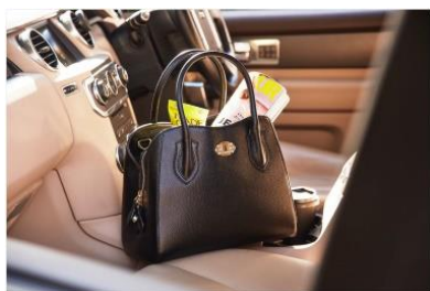
「Short Trip, Long Island」

商品のディテールや背景、ブランドのフィロソフィーなどにスポットを当てるコラム「JOURNAL」を1週間に1回更新、商品ごとに特集を組んで紹介するという、通常の EC サイトとは異なる切り口で、ANNA SUI の世界観を伝えていきます。