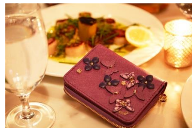
「Dinner at the Ludlow Hotel」