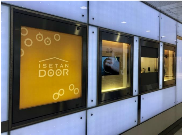
ショーウィンドー全8面で<ISETAN DOOR>を展開中

3月27日（水）から、伊勢丹新宿本店 本館地下1階 地下パーキング側玄関外 ショーウィンドー（新宿三丁目駅B5出口付近）を使用し、受賞作品の放映を行っています。