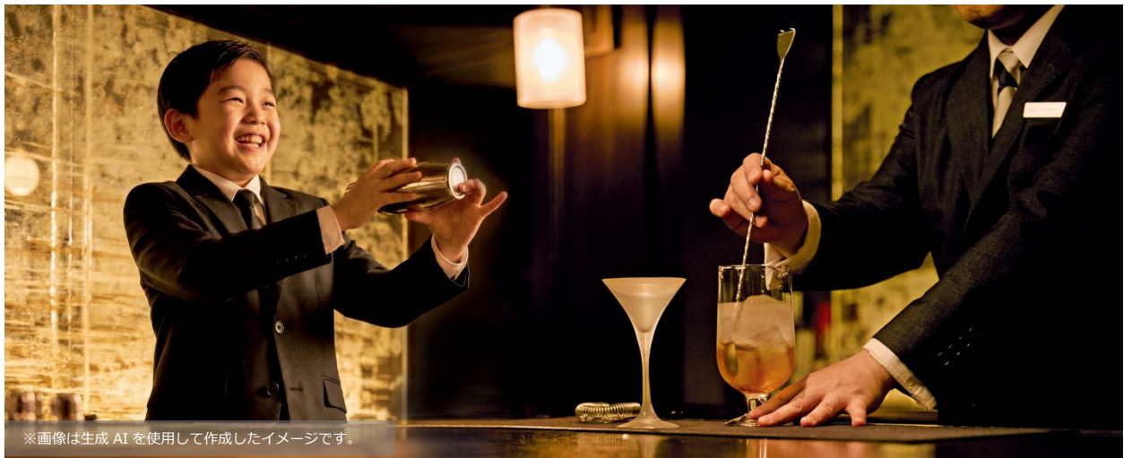
※画像は生成 AI を使用して作成したイメージです。