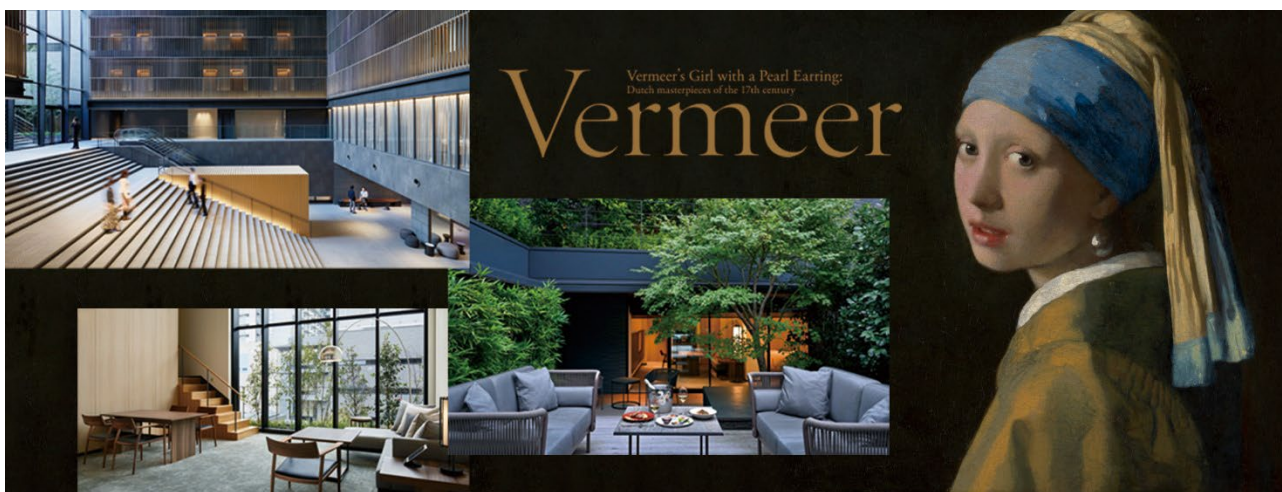
(左上) ザ・サウザンド京都 大階段 (左下) ザ・サウザンド京都 ザ・サウザンド・スイート (中央) ザ・サウザンド京都 ガーデン・スイート (右) ヨハネス・フェルメール 《真珠の耳飾りの少女》1665年頃 マウリッツハイス美術館