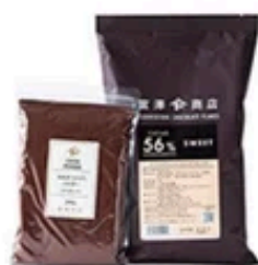
チョコレート・ココア