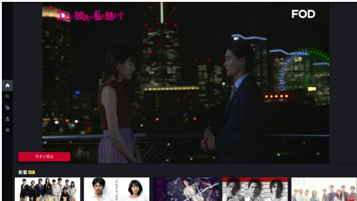
テレビアプリ「FOD」イメージ画像

フジテレビが運営する動画配信サービス FOD にて提供しているテレビアプリ「FOD」が、2021年12月13日（月）に累計ダウンロード数 500 万件を突破したことをお知らせします。