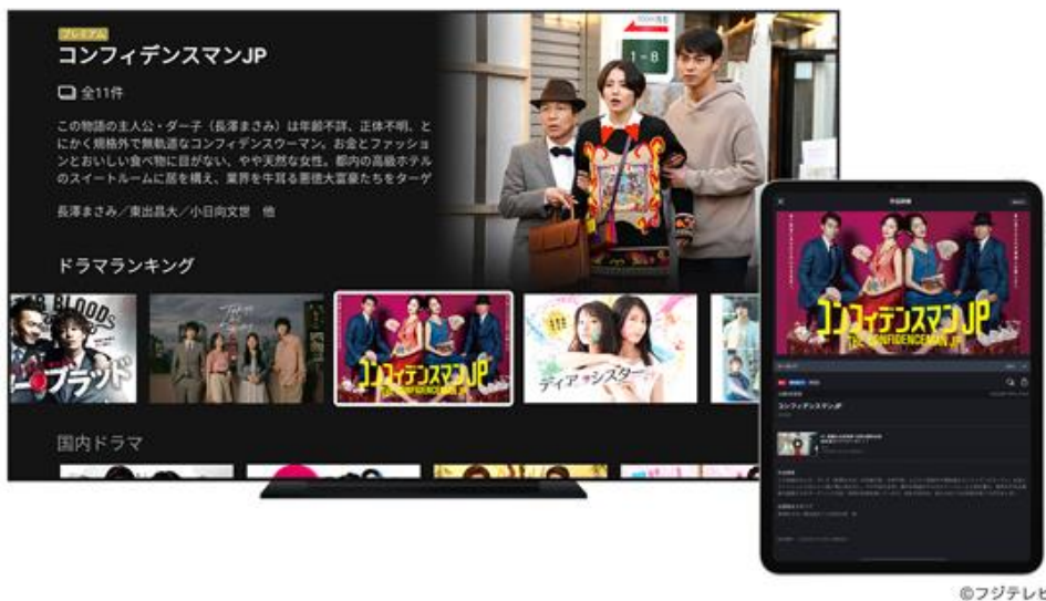
スマートフォンアプリ「FOD」イメージ画像

フジテレビが運営する動画配信サービスFODにて提供している、FOD関連アプリが、2023年6月7日(水)に累計ダウンロード数3,000万件を突破したことをお知らせします。