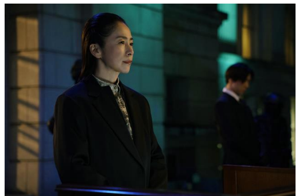
西田尚美