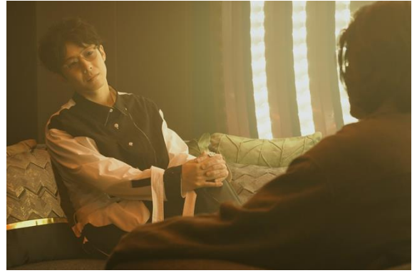
水間ロン