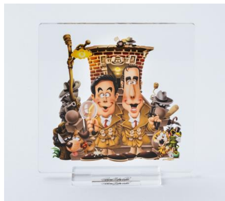
カトちゃんケンちゃん アクリルスタンド 2,200 円(税込)