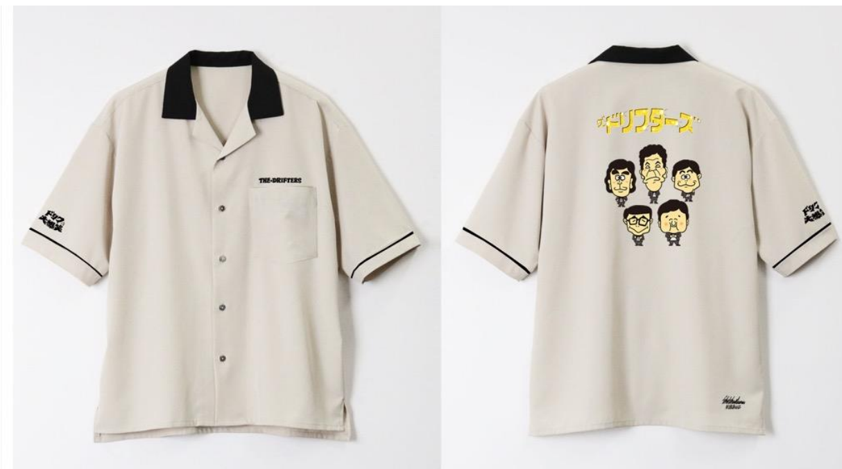
刺繍マニアプロデュース ボーリングシャツ 機械刺繍 (左:FRONT 右:BACK) 23,200 円(税込)