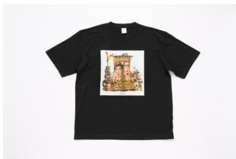
カトちゃんケンちゃん Tシャツ 4,950 円(税込)