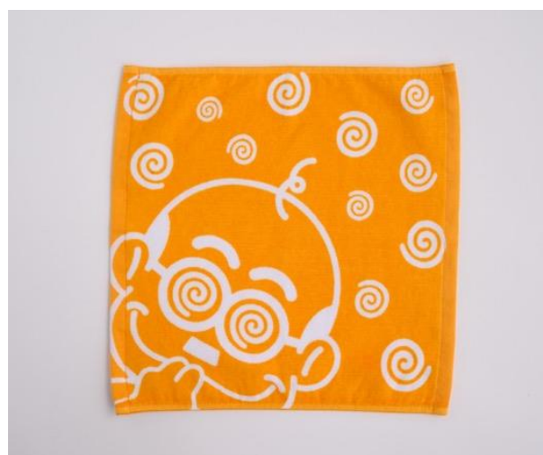
加トちゃんハンドタオル 1,650 円(税込)