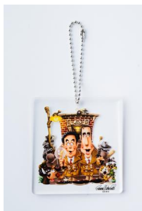
カトちゃんケンちゃんアクリルキーホルダー 1,100 円(税込)

※フジテレビeshop7/18(木)から発売開始。イベント会場では、7/20(土)より発売開始。