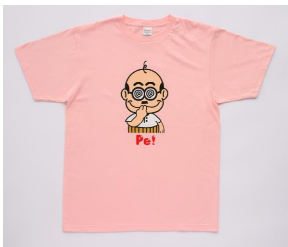
加トちゃん Pe! Tシャツ 4,400 円(税込)