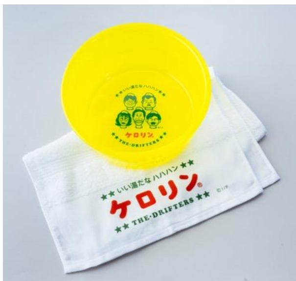
ケロリン桶とタオルセット 4,950 円(税込)