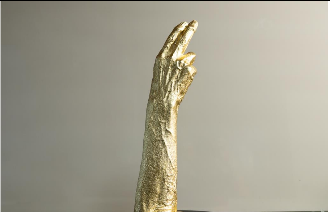
神の手ならぬ神の「ペ像」