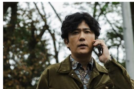
稲垣吾郎