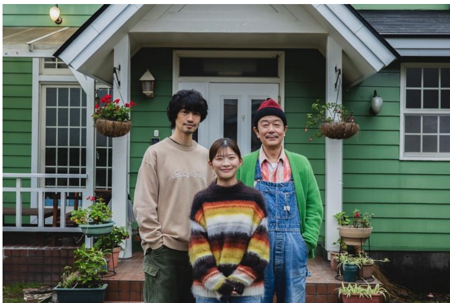
ドラマ『ペンション・恋は桃色 season3』

フジテレビが運営する動画配信サービス FOD にて、ドラマ『ペンション・恋は桃色 season3』を制作、2025年1月10日(金)より配信することが決定しました。