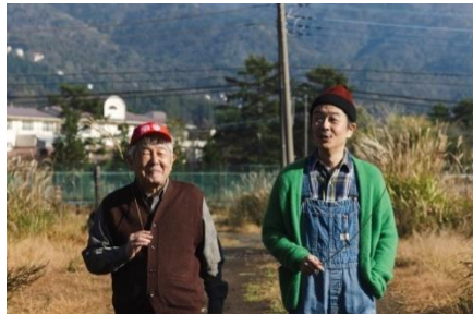
(左から)鈴木慶一、リリー・フランキー