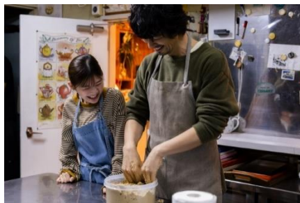
(左から)伊藤沙莉、斎藤工