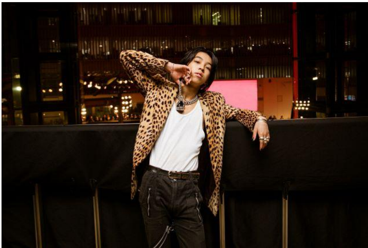
『令和のロックスター』 (C) TOYOHIRO MATSUSHIMA

フジテレビが運営する動画配信サービスFODにて、2022年に19歳という若さで突然この世を去ったYOSHIのトリビュートドキュメンタリー『令和のロックスター』を、5月15日(木)0時より配信することが決定しました。また、本作品の公開に先駆け、ラフォーレミュージアム原宿にてYOSHI企画展『令和のロックスター』が4月26日(土)から5月11日(日)の期間で開催されます。