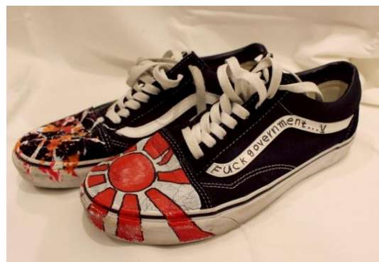
YOSHI がペイントアートを加えたスニーカー