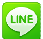
(上下とも)「LINE で送るボタン」