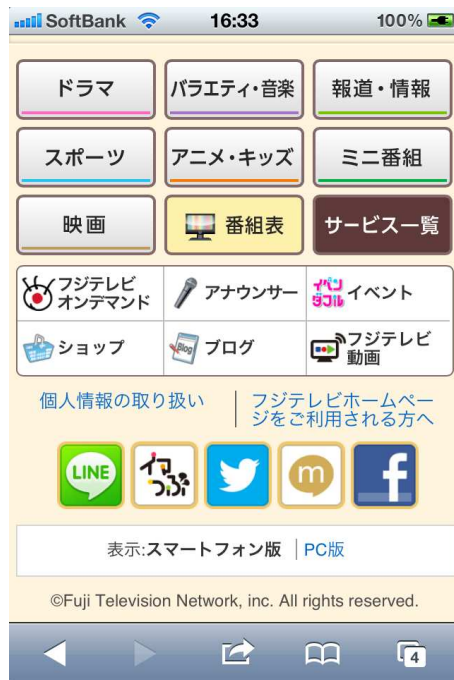
フジテレビ HP スマートフォン版 TOP ページ(下部)