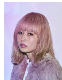
PORIN (Awesome City Club)