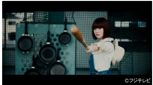
「ワールド タマゴボール クラシック」

フリーランスの映像ディレクターとして活動。CM/VP/MV/TV 短編ドラマなど幅広いジャンルで活躍。近年の監督作に、小学生あるあるを描いた「KIRIN プラズマ乳酸菌」WEBCM、在日ファンク「ぼいぼい」MV、満島ひかり主演ドラマ「人間椅子」など http://shuheishibue.com