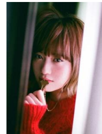
SHE IS SUMMER