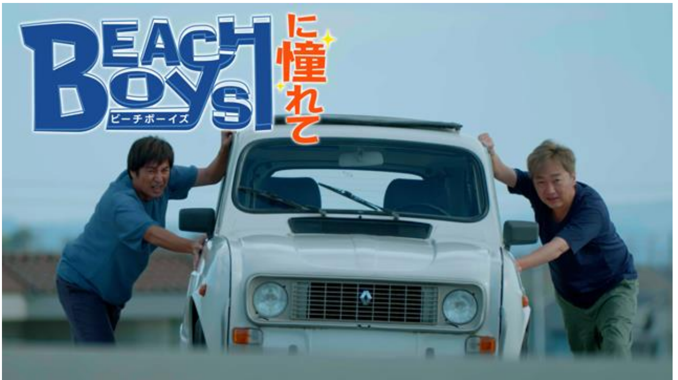
『ビーチボーイズに憧れて』

フジテレビとBSフジが共同制作したドラマ『ビーチボーイズに憧れて』全4話を、フジテレビが運営する動画配信サービスFODにて、12月15日(金)20時から一挙配信することが決定しました。