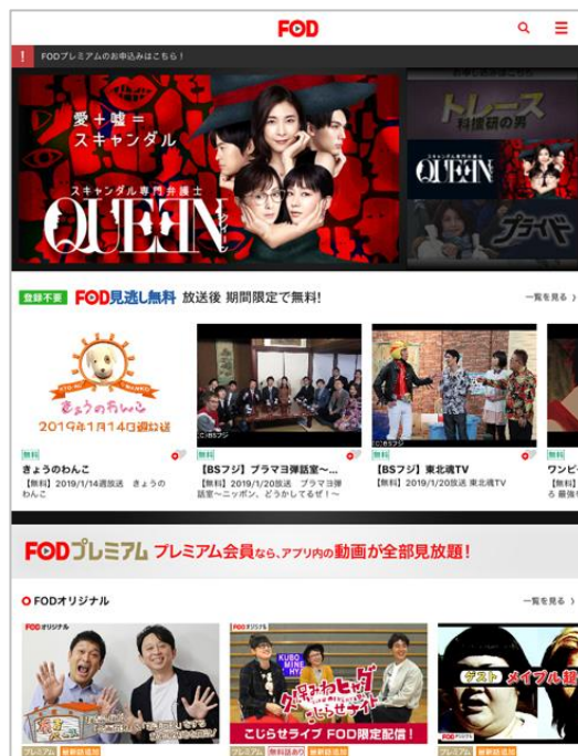
アプリ「FOD」スマートフォン、タブレット TOP 画像

フジテレビが運営する動画配信サービス「FOD」は、2012年にスマートフォンでのサービスを開始しました。アプリ「FOD」は、2015年1月に開始したドラマやバラエティの最新話が無料で視聴できる「FOD 見逃し配信」の前身「プラスセブン」のサービスと同時に配信を開始しました。2016年には、定額制見放題サービス「FOD プレミアム」のコンテンツを視聴可能するなどサービス面を充実させ、2017年7月に累計500万ダウンロード、2018年3月に700万ダウンロードと順調にダウンロード数を伸ばして参りました。