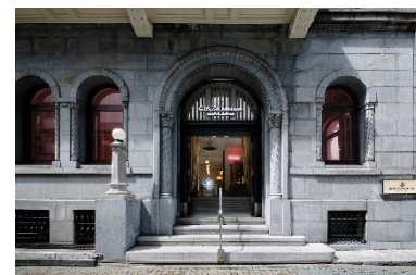
「銀座メゾン アンリ・シャルパンティエ」 店舗外観

「銀座メゾン アンリ・シャルパンティエ」は当ホテルから徒歩1分の銀座柳通りにあり、ブティックスペースに加え、サロンスペースでは、季節の素材を使った本格的なテーブルデザートの実演をお楽しみいただけます。