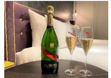
マム グラン コルドン

「Only the Best~最高のシャンパーニュだけを~」という理念を掲げる1827年創業のメゾン マムの代表的なシャンパーニュ。フランスの勲章レジオン・ドヌールを模した赤いリボンが印象的なボトルデザインで、ピノ・ノワールの力強さやストラクチャーと、シャルドネのもつエレガンスさとミネラル感、ムニエのもつフルーティさがほどよいバランスを取り、大胆で豊かな味わいのワインに仕上がっています。