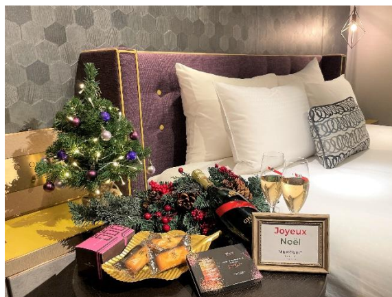
フレンチシックで印象的なデザインのデラックスクイーン (クリスマス装飾等はプランに含まれません)

フランス発 香りのアソートと銀座の名店フィナンシェ付き期間限定宿泊プラン 「mam グラン コルドン」で乾杯★銀座の隠れ家で過ごすクリスマス 宿泊期間：2021年12月17日（金）～2021年12月25日（土）