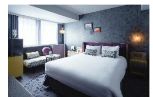
デラックスクイーン