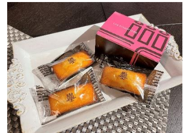
アンリ・シャルパンティエの フィナンシェ

1975年の発売より長年愛され続けているフィナンシェ。誕生以来40年以上にわたり素材やレシピを何度も見直し、さらなるおいしさを求めてきました。甘味が凝縮されたカリフォルニア産アーモンドと北海道根室・釧路地域の生乳を使ったオリジナルの発酵バターのお厚みをお楽しみください。