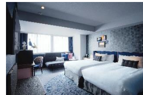
プリビレッジツイン