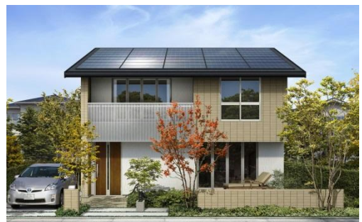
※「太陽を活かす家」外観イメージ 太陽光発電10.2kW搭載 延床面積107.65㎡(32.56坪) 本体価格1,880万円(税込)

発売期間：「カンナ社長のエコであたたかフェア」開催期間中 2014年10月1日（水）から 12月23日（火）まで期間限定 仕様：自由設計 長期優良住宅対応