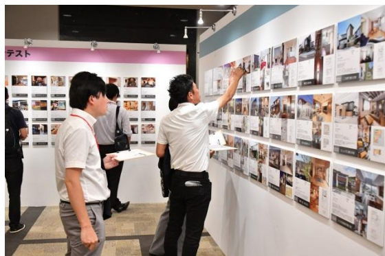
【写真】コンテストに投票する来場者の様子

デザインコンテストでは、普遍の美を活かし、お客様のこだわりや希望を叶えながら、デザインに優れた住まいを競います。しあわせデザインコンテストでは、家族や近隣とのコミュニケーションが誘発され絆が育まれるようなシカケや取り組みを競います。住みこなしコンテストでは、住まい手による、ご入居後の工夫にスポットをあて、それらが住まいを十二分に活かしているかを競います。コンテストは開催当初より大きな反響があり、今年は応募総数1,177件のうち、入賞19作品、審査員特別賞4作品、優秀賞2作品が受賞。同日の豊かな暮らしを考える交流会で表彰式が行われました。