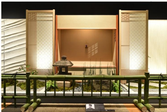
【写真】匠職人の方と住宅のコラボレーション

全国大会のメイン会場と隣接するホールでは、これまで行ってきた研究・開発などアキュラホームの取り組みをパネル展示しています。本年度40周年を迎えるアキュラホームグループの創業から現在までの軌跡の他、AQレジデンスなどでコラボレーションを実現している匠職人の方々（左官・庭・和紙・組子・数奇屋大工など）の作品を展示。中央部分では、港北展示場キラクノイエ、AQレジデンス馬込展示場、神戸展示場変容する家の臨場感あふれる映像を三面の大型スクリーンに映し出し、来場者に体感いただきました。