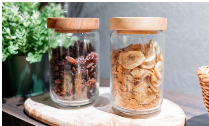
エグゼクティブフロア専用ラウンジ