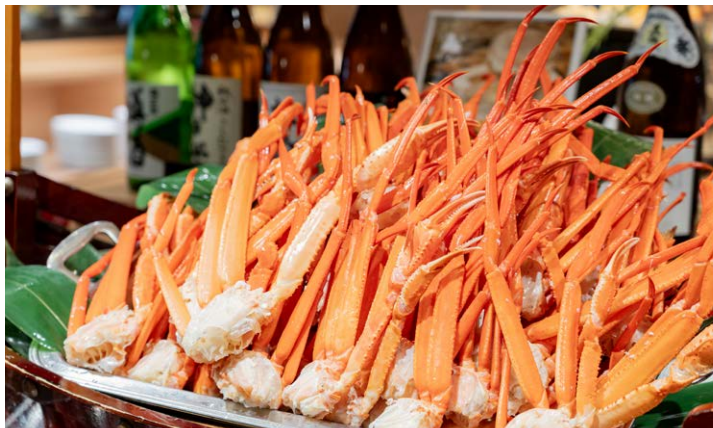
THE HARBOR Buffet Dining