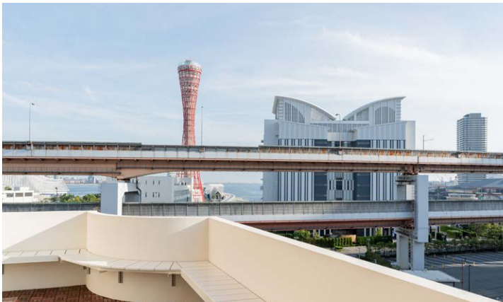
エグゼクティブフロア専用 ポートテラス