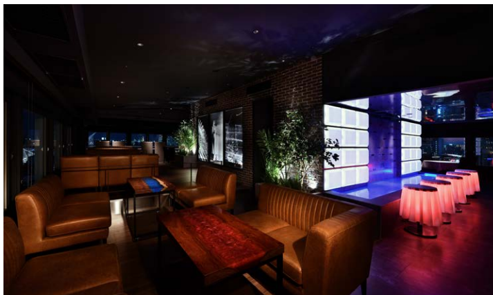
HIDE OUT トリュフレストラン&バー