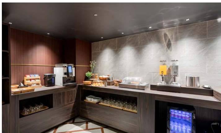
エグゼクティブフロア専用ラウンジ