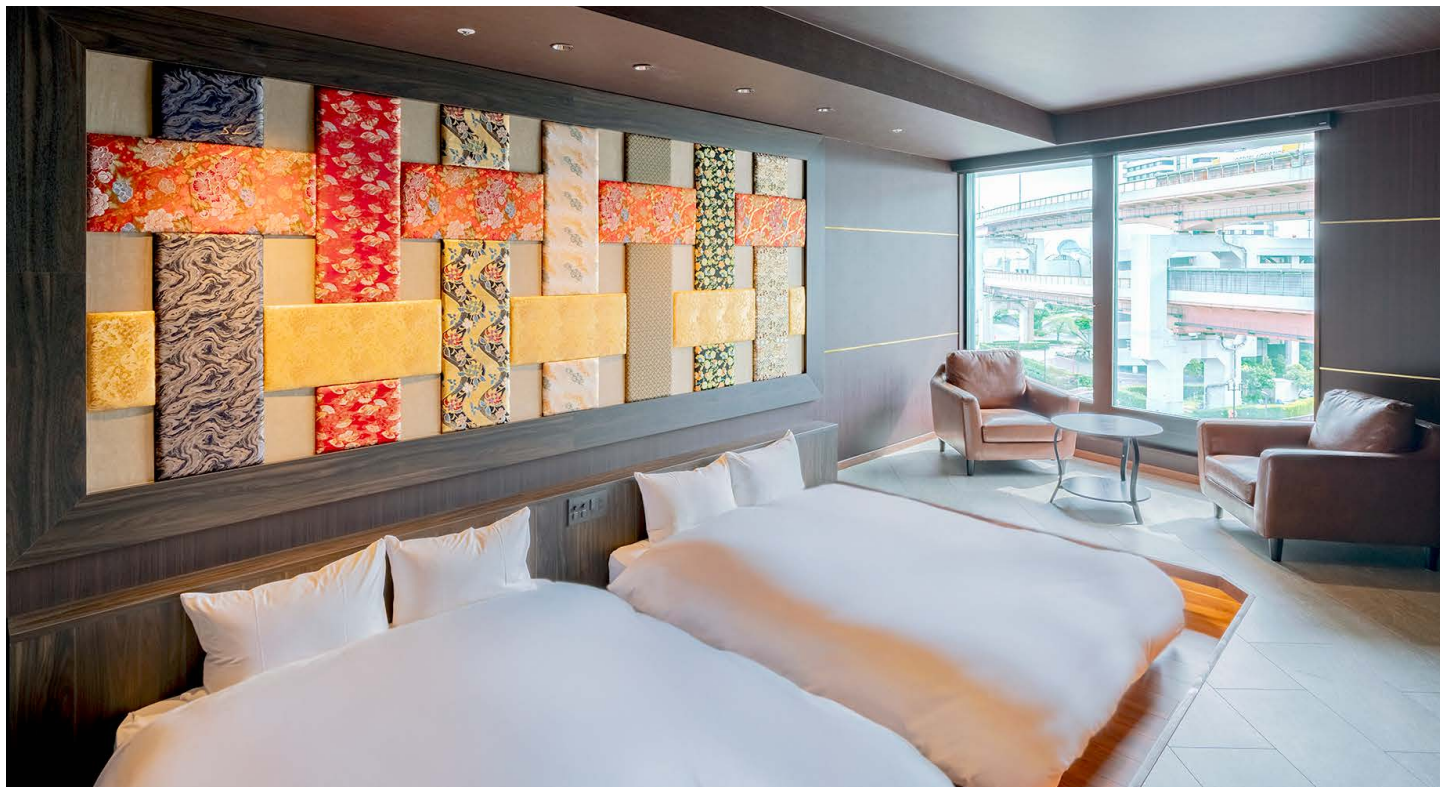
クラブツイン(クラブフロア)

神戸ポートタワーホテル(所在地:兵庫県神戸市)は、2024年8月に全面リニューアルしたエグゼクティブフロアを活用し、2025年2月限定の特別宿泊プラン「冬の神戸、贅沢ステイプラン」をご提供いたします。冬の神戸ならではの滞在を楽しむ機会として、上質なひとときをお届けします。