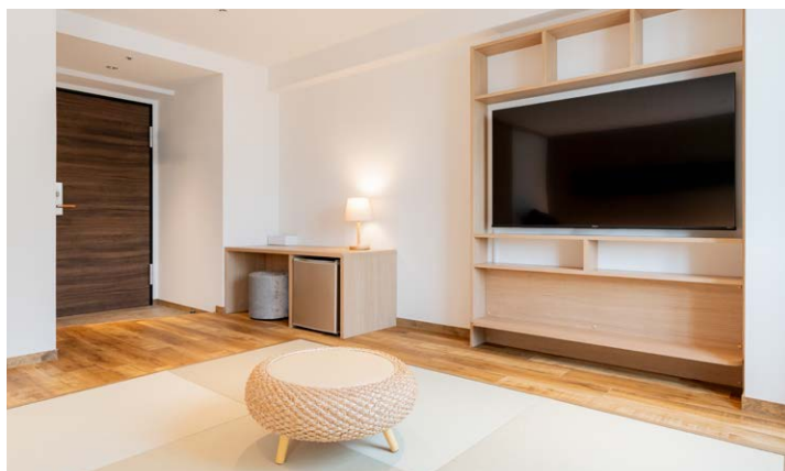
アーバントリプル(アーバンフロア)