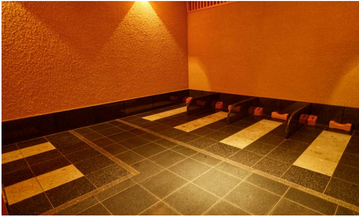
エグゼクティブフロア専用岩盤浴

また、最上階のレストラン「HIDEOUT」では、専用の朝食をご用意し、3方向が大きな窓という解放感ある空間で、美しい神戸の朝の風景をお楽しみいただけます。