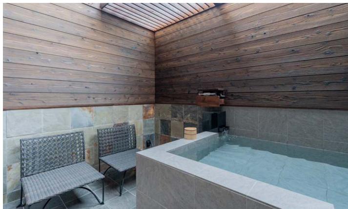
クラブツイン露天風呂(クラブフロア)