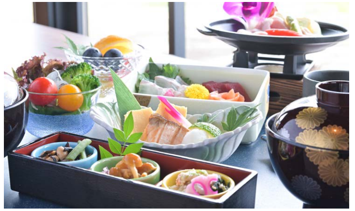
エグゼクティブフロア専用 展望朝食

エグゼクティブフロアにご宿泊のお客様だけが体験できる特別なサービスも充実させました。宿泊者専用ラウンジでは、昼はティータイム、夜はカクテルタイムを優雅に楽しめる特別な空間をご提供します。