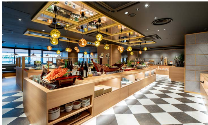
THE HARBOR Buffet Dining