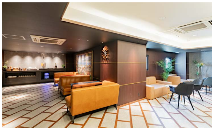
エグゼクティブフロア専用ラウンジ