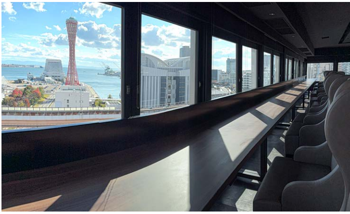
最上階レストラン「HIDE OUT」