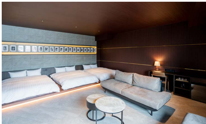
After クラブデラックストリプル(クラブフロア)