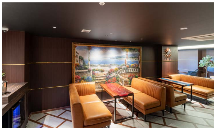
エグゼクティブフロア専用ラウンジ