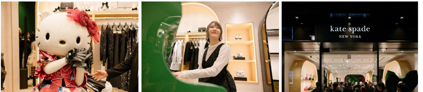
レセプションパーティの様様

11月30日(土) のリニューアルオープン同日には、世界共通言語であるJoy(喜び)、前向きさ、時代を超越したスタイルをもつブランドとして知られてきたケイト・スペード ニューヨークと、50年にわたり、世界中の人々に友情と思いやりを届けてきたハローキティのコラボレーションコレクションが銀座旗艦店限定先行発売され、世代を超えたお客様に愛される、タイムレスで、完成度の高いコレクションを通して、共にJoy(喜び)を喚起していきます。