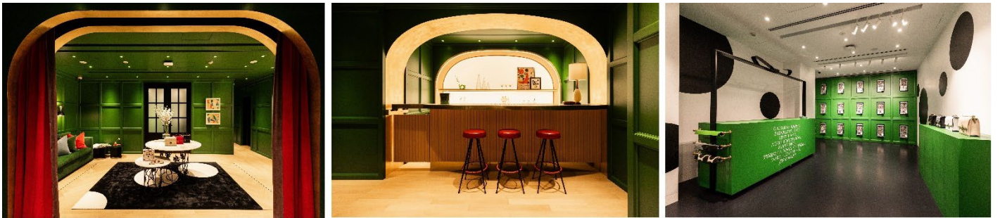
銀座旗艦店外装・内装