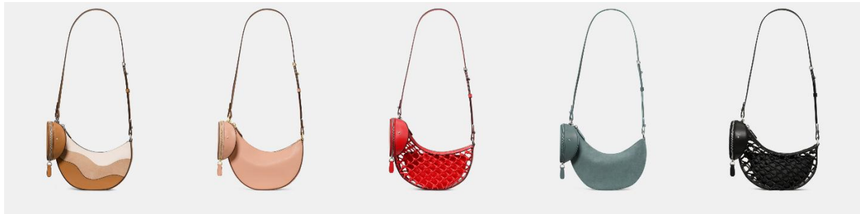
左から：ケーエスデュオ ウェビー スエード クロスボディ バッグ ¥57,200、ケーエスデュオ クロスボディ バッグ ライトカンタローブ ¥52,800、ケーエスデュオ ウーブン クロスボディ バッグ エアルームト ¥69,300、ケーエスデュオ スエード クロスボディ バッグ ダークイングリッシュ シー ¥62,700、ケーエスデュオ ウーブン クロスボディ バッグ ブラック ¥69,300、すべて税込み価格。サイズ：22 cm × 27 cm × 7 cm

Summer 2026 コレクションは、ケイト・スペード ニューヨークのヘリテージを軸に、ポジティブで洗練された夏のムードを軽やかに表現。鮮やかなカラー、上質なマテリアル、そして遊び心のあるディテールが、開放感あふれるサマースタイルを彩り、ブランドの世界観をいきいきと映し出します。今季は、夏のワードローブやシーズンを楽しむためのスタイリングにも自然に溶け込む、自由で前向きなムードがコレクション全体に広がります。