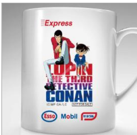
賞品: 限定マグカップ

期間中に、エッソ・モービル・ゼネラルのセルフサービスステーション「エクスプレス」で、ガソリンまたは軽油を20ℓ以上給油するともらえる引換えチケットを3枚集めると、「ルパン三世 vs 名探偵コナン THE MOVIE」の「限定マグカップ」をもらえなく (※) プレゼントします。