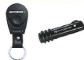
スピードパス、スピードパスプラス

また「スピードパス」、「スピードパスプラス」に入会された方にも「限定マグカップ」をプレゼント (※) します。スピードパスとは、エクスプレス店舗で専用端末にかざすだけで、即時決済できる入会金・年会費無料、盗難保障付きの安心・便利な決済ツールです。