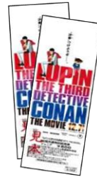
賞品:映画親子ペアチケット