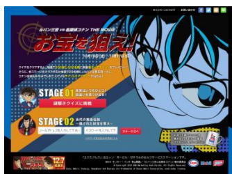
特設サイトイメージ(コナン ver.)