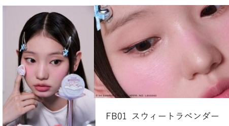
FB01 スウィートラベンダー