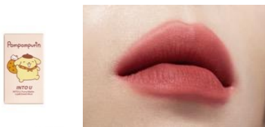
L-FM01 わくわくチェリー