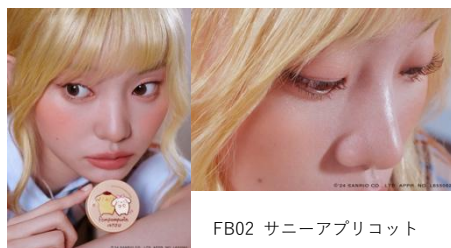
FB02 サニーアプリコット