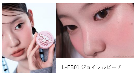
L-FB01 ジョイフルピーチ