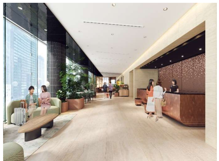
ロビーラウンジイメージ