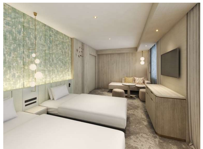
デラックスツインイメージ