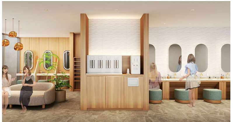
女性脱衣所イメージ