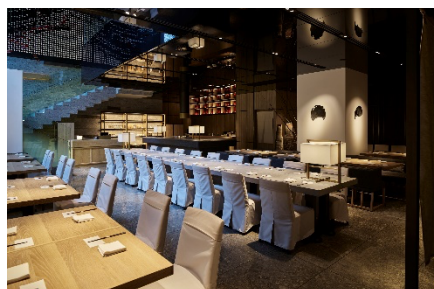
ホテルB1 レストラン「現代里山料理 ZEN HOUSE」

https://go-gardenhotels.reservation.jp/ja/hotels/mgh002/