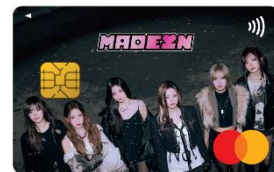
<MADEIN Orico Card>

オリコが2024年3月より開始した「デジタルカード」スキームを用いることで、お申し込みから最短60秒で審査が完了し、その後オリコ会員向けWebサービス「eオリコ」に登録いただくと、ECなどのオンライン決済にカード支払いが可能となり、店頭などでの非接触決済(Apple Pay・Samsung Wallet)も即時にご利用いただくことが可能です。