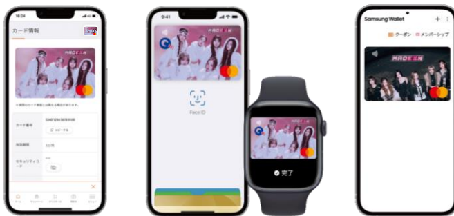
<MADEIN Orico Card less(FCL)>