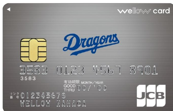
wellow card Dragons (ウィローカードドラゴンズ)

なお、本カードのお申込み受付は、2022年日本プロ野球公式戦の中日ドラゴンズホーム開幕戦となる2022年3月29日(火)より開始いたします。