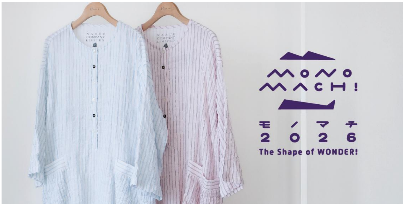
「モノマチ2026」のテーマは「The Shape of WONDER!」

当日はイベント限定のコンテンツや、ここでしか手に入らないアイテムなどをご用意しています。皆さまのご来場を心よりお待ちしております。