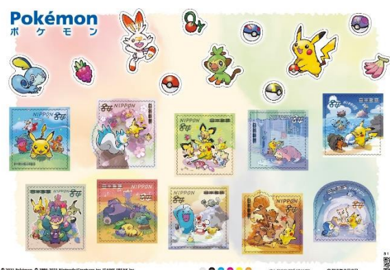
日本国際切手展 2021 内で購入できる グリーティング切手「ポケモン」 84 円郵便切手のデータ

©2021 Pokémon. ©1995-2021 Nintendo/Creatures Inc./GAME FREAK inc. ポケモン・Pokémonは任天堂・クリーチャーズ・ゲームフリークの登録商標です。