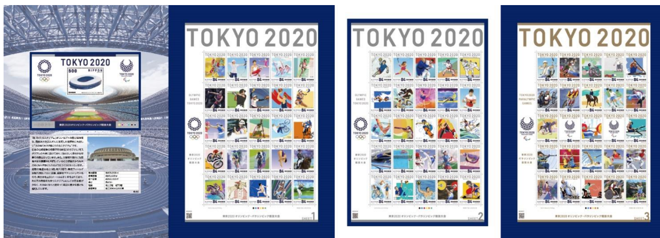
東京2020オリンピック・パラリンピック競技大会 切手帳