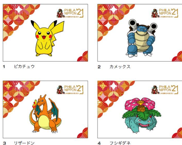
郵便局体験コーナーでもらえる ポケモンポストカード

また、自分の声が「色とカタチ」になりオリジナルはがきを作成することができる「Voicelはがき作成コーナー」や世界にひとつだけのフレーム切手が作成できる「オリジナルフレーム切手作成コーナー」、文具コラボレーション商品の販売、印刷・協力会社等のブースなど、夏休みの終わりに、子どもから大人まで様々な方に広くお楽しみいただけるイベントです。