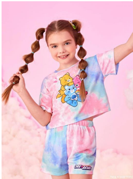
商品名：絞り染め 漫画グラフィック ドロップショルダー Tシャツ&文字グラフィック ショートパンツ 価格：¥1,245 コード：sk2202237389131866