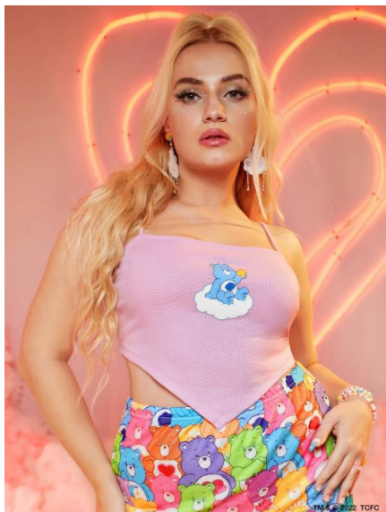
商品名：熊プリント ハンカチヘム キャミトップ 価格：¥672 コード：sf2202156644636730