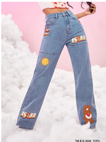
商品名：クマ&文字グラフィック ストレートレグジーンズ 価格：¥3,324 コード：sw2202141815466644