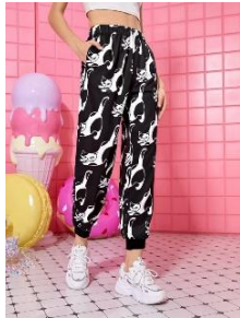
SHEIN X Noko 漫画風猫グラフィック スウェットパンツ