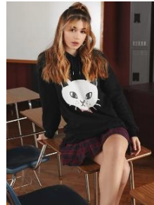
SHEIN X Noko 猫プリント ドロースtring ポーチ ポケット フード付きスウェットシャツドレス