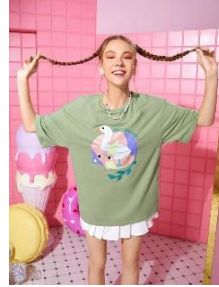
SHEIN X Noko ドロップショルダー アルファベット & 猫プリント ティー