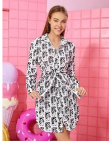
SHEIN X Noko オールオーバープリント ベルト シャツドレス