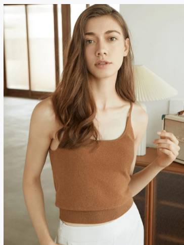
商品名 : MOTF PREMIUM カジュアル プレーン レディース ニットトップス SKU : sw2108241907217121 価格 : ¥5,555 (税込)

URL : https://jp.shein.com/campaign/motfcashmerewool