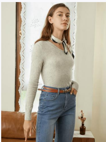
商品名 : MOTF PREMIUM セーター レギュラーフィット 1 SKU : sw2108149349347434 価格 : ¥9,890 (税込)