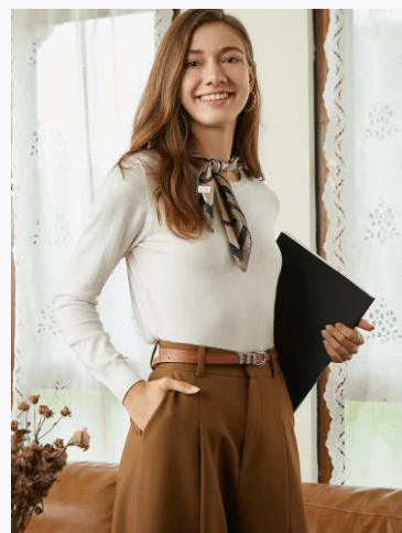
商品名 : MOTF PREMIUM セーター 1 SKU : sw2107295105919811 価格 : ¥4,395 (税込)