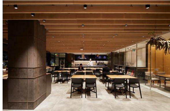
3階シェアダイニング / 4階コワーキングスペース、ファクトリーキッチン