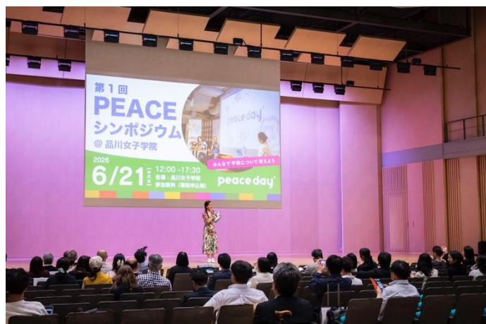
【当日のステージの写真】