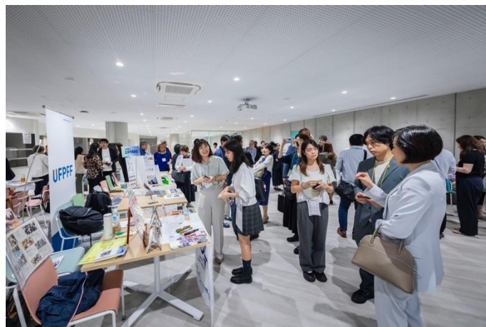
【ピッチリレー／ブース交流の様子】