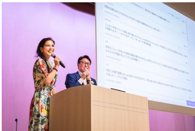
【俳優・タレントのサヘル・ローズ氏】

俳優・タレントのサヘル・ローズ氏もMCとして参加し、登壇者一人ひとりの活動に真摯に耳を傾けながら対話を重ね、会場全体を温かな雰囲気で見守りました。