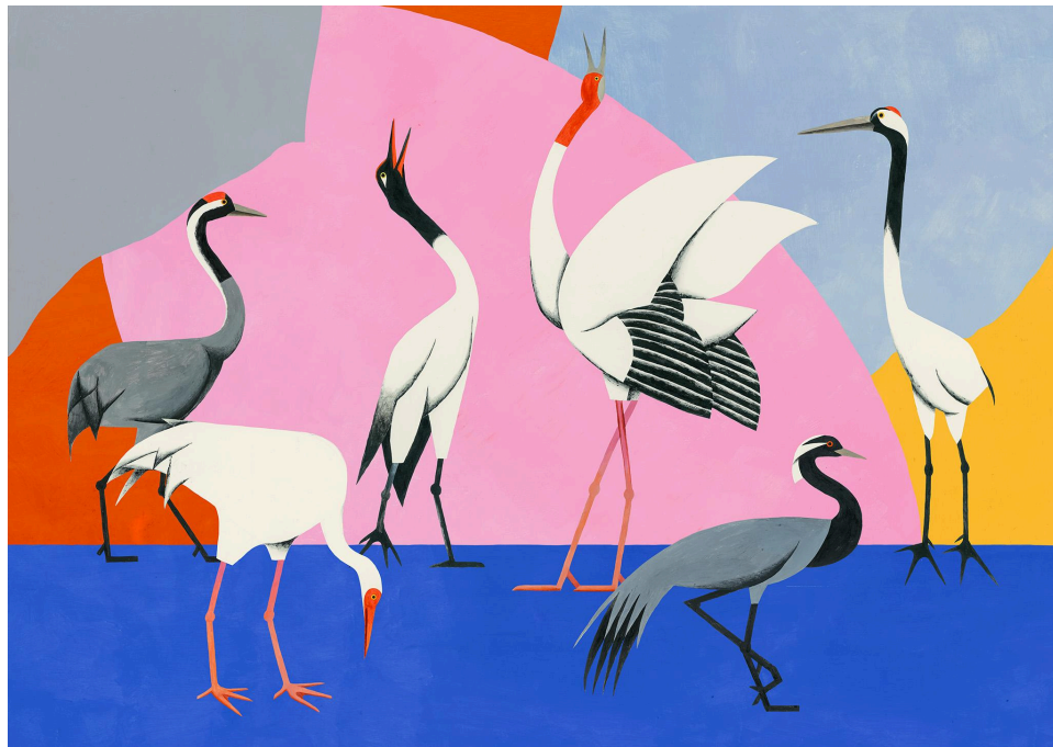
Roberts Rurans _Cranes_ (2020)

「Baltic Island」は、作品を鑑賞するだけの場ではなく、創造的な交流のためのプラットフォームとしても展開されます。