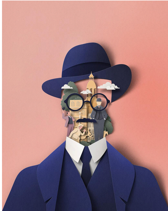
Eiko Ojala _James Joyce_ (2022)