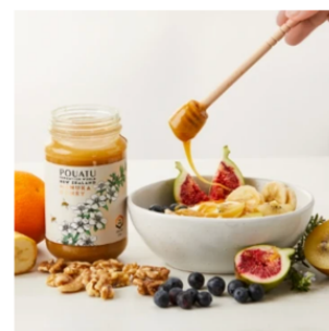
高品質なフレーバー

女王蜂の育成や採配、どの養蜂場からいつ採取するかタイミング、瓶詰め段階もミリ単位で徹底管理をする職人技が味にも反映されている。