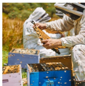
クラフトマンシップ

自然そのままの個性が活きるため、環境や土壌、ミツバチと向き合い、自然との共生を大切にしている。